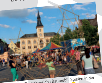
Großer Kinderbereich | Baumobil, Spielen in der Stadt e. V., Seifenblasenwerkstatt 4