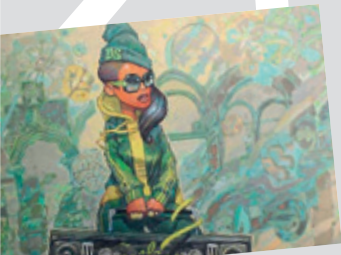
Live-Kunst am Hauptplatz | Cike 1 12