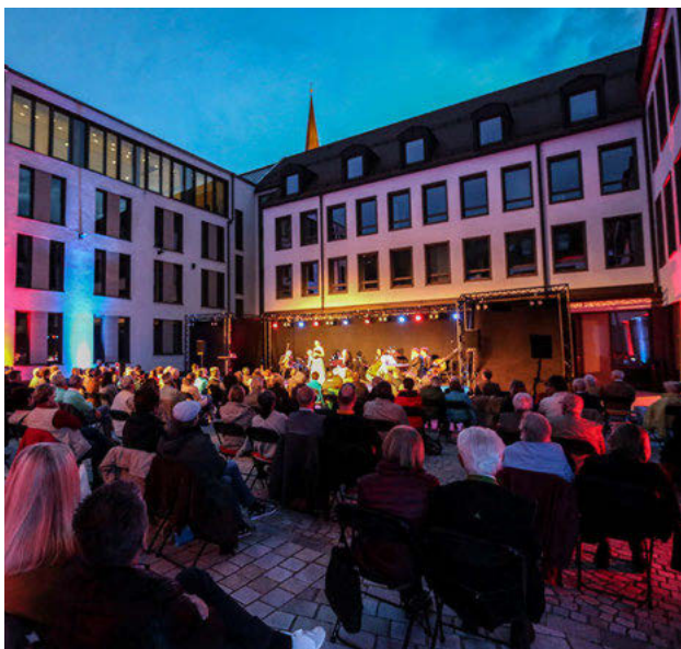
Konzerte, Kabarett und Lesungen auf der Kultursommer-Bühne

Dankenswerterweise stellt der Landkreis auch in diesem Jahr wieder diesen direkt am Hauptplatz gelegenen Innenhof zur Verfügung. Auch um das Konzept der Stadt zu unterstützen: aktive Kulturförderung für alle an den Veranstaltungen Beteiligten.