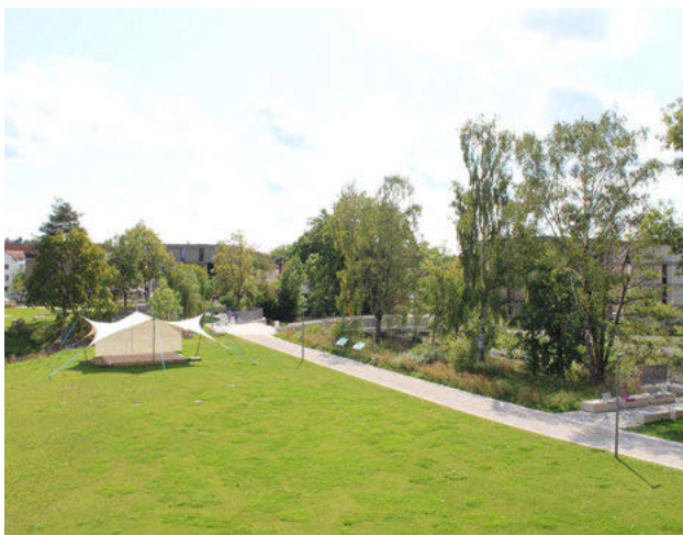
Blick auf die Veranstaltungswiese. Die Sitzflächen werden beim Ticketkauf zugewiesen.

Die Veranstaltungen werden nicht bestuhlt. Es empfiehlt sich daher, eine Picknickdecke oder eine ähnliche Sitzgelegenheit mitzubringen. Sie finden auch bei leichtem Regen statt. Bitte bringen Sie entsprechende Kleidung mit.