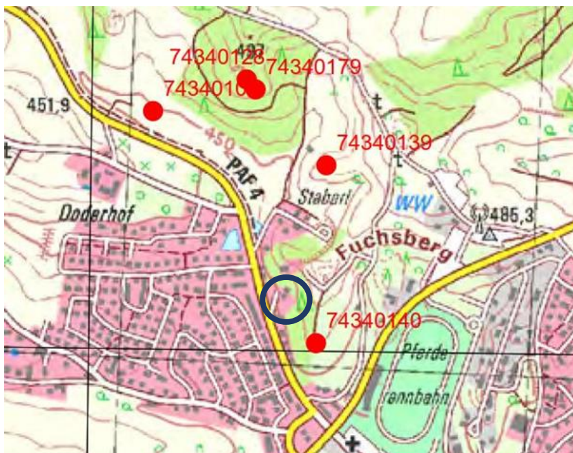
Abb. 3: Artenschutzkartierung Bayern, TK 7434 Hohenwart mit Eintragung des Geltungsbereichs

Folgende Ziele und Umweltbelange der Artenschutzkartierung Bayern wurden bei der Planung berücksichtigt: