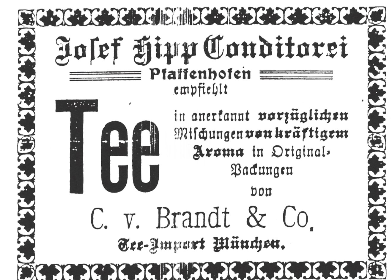
Inserat aus dem Amtsblatt für das königliche Bezirksamt Pfaffenhofen

Als Teefachhändler beziehen wir heute in kurzen Abständen unsere Teesorten und können somit unseren Kunden das volle Aroma der frischen Tees bieten. In unserem Teeladen finden Sie ein großes Sortiment an Schwarztee, grünem Tee, Früchte-tee, Roibusstee und Kräutertee. Außerdem fertigen wir individuelle Geschenkarrangements und ideenreiche Verpackungen unserer Tees.