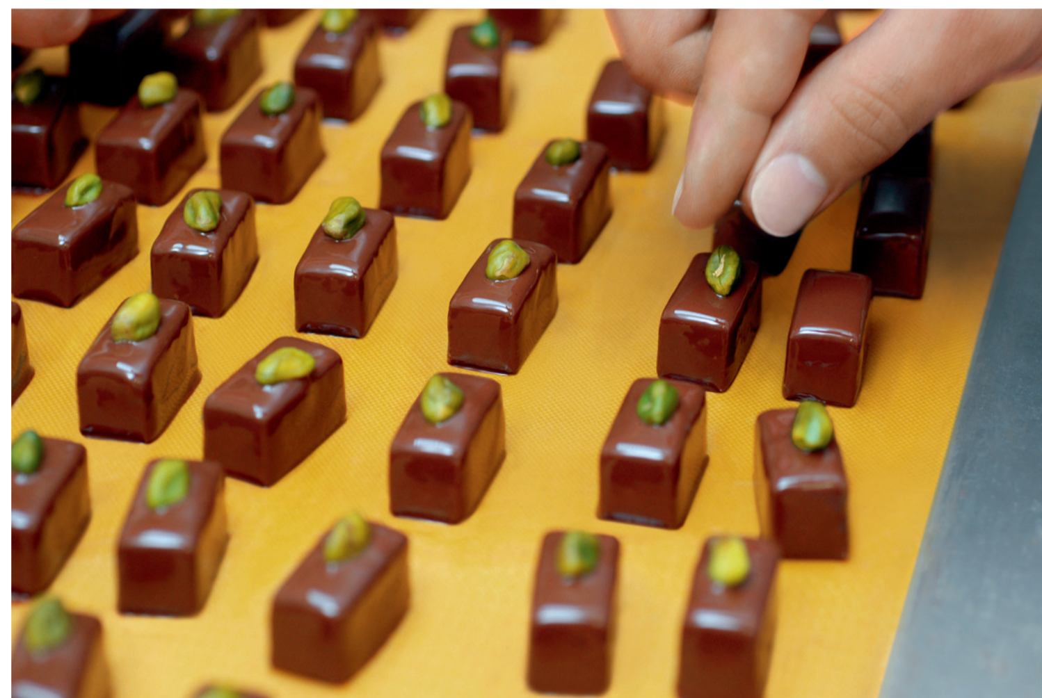
Fertigung von Pistazienpralinen