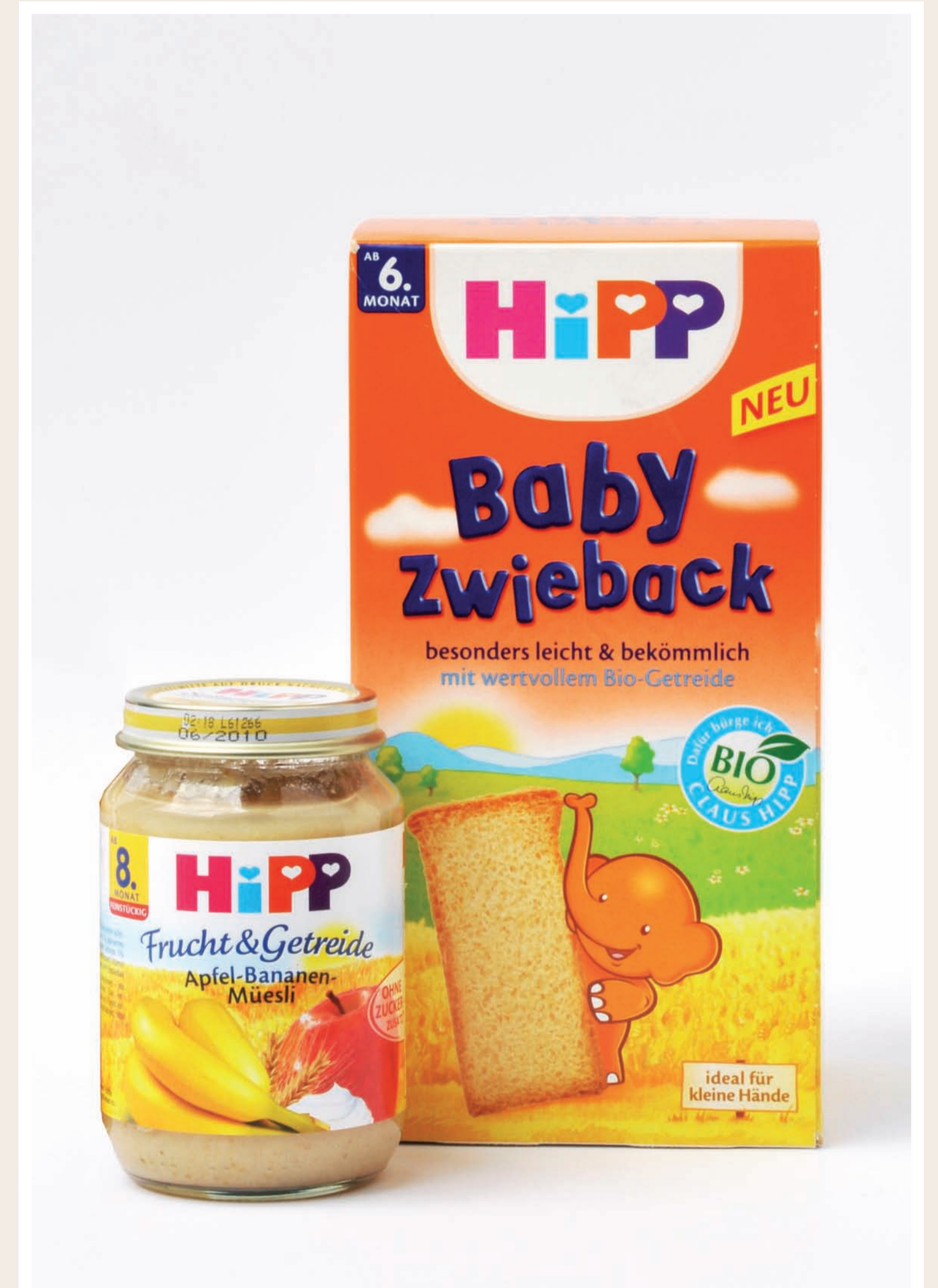
Aktuelle Produkte der Firma Hipp-Babykost in Pfaffenhofen

Aus Platzmangel musste nun die Produktion des Kinder-Zwiebackmehls aus dem Lebzelterhaus in die heutige Georg-Hipp-Straße 7 in Pfaffenhofen ausgelagert werden. Hier baute mein Onkel Georg Hipp in einer Generation die heutige Weltfirma „Hipp-Babykost“ auf. Neben mehreren Herstellungsbetrieben im Ausland ist der Hauptsitz der Firma Hipp-Babykost in Pfaffenhofen.