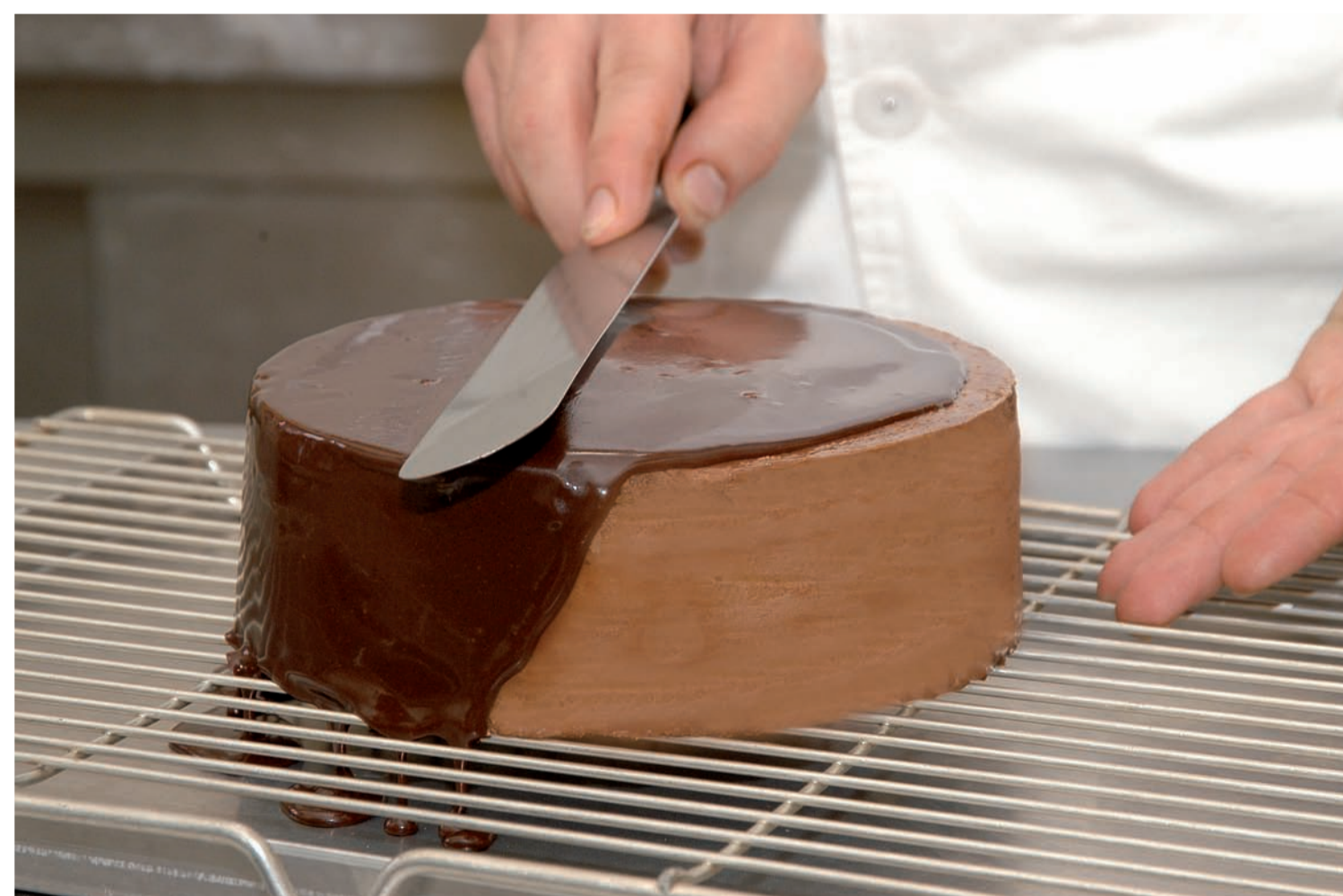
Überziehen einer Prinzregententorte

Unsere große Leidenschaft gilt der Herstellung und Verarbeitung von hochwertigen Schokoladen. Die Café Hipp Pralinen werden in unserem Haus frisch für Sie hergestellt. Deshalb können wir im Gegensatz zu industriell gefertigten Pralinen auf jegliche Konservierungsstoffe verzichten.