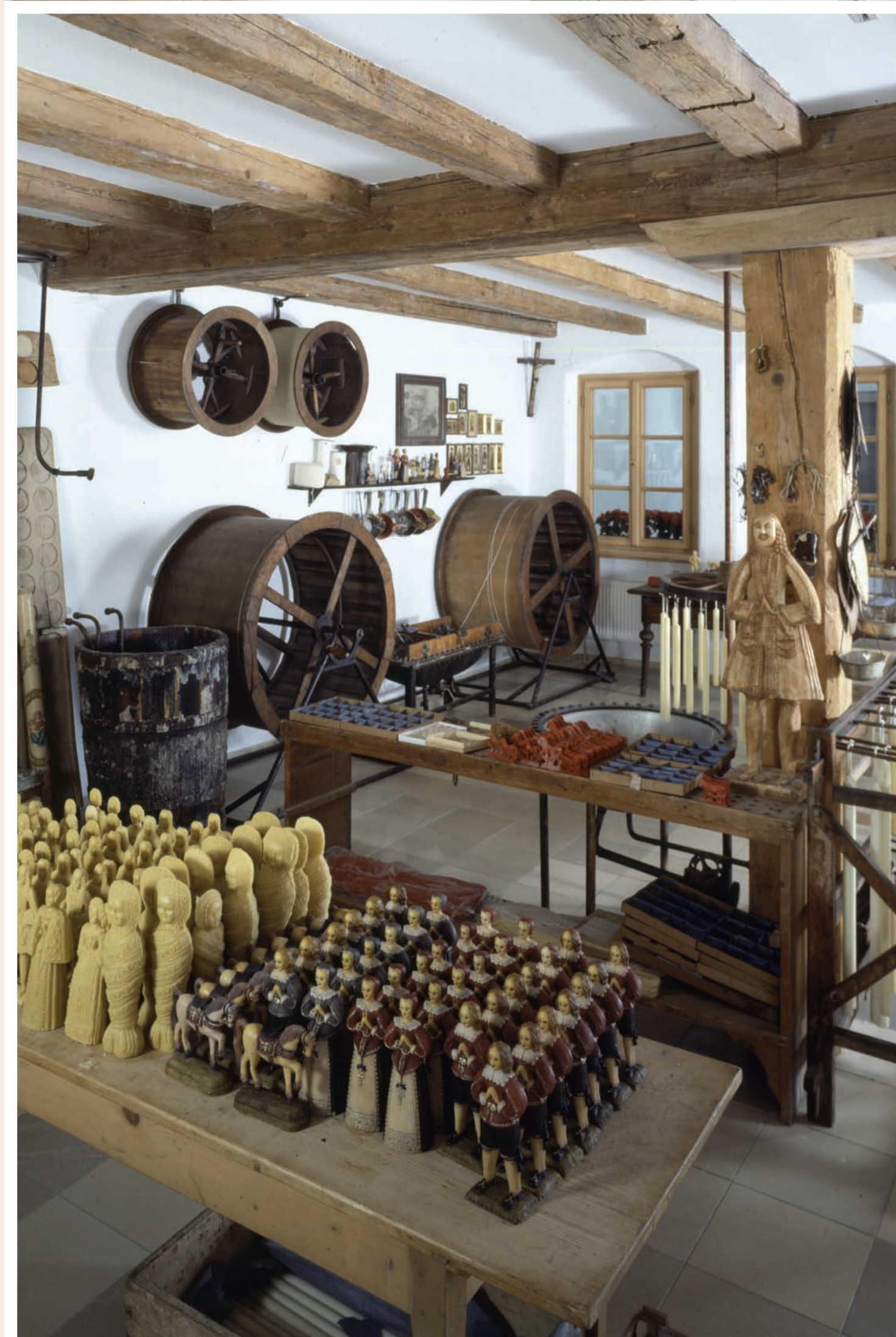
Lebzelttermuseum im 1. Stock

Lebzelter – Wachszieher – Metbrauer Hans Hipp, Dachauer Museumsschriften, Verlagsanstalt Bayernland Dachau, 1987