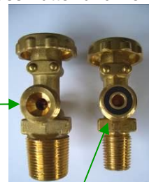
Absperrventil 5-, 11-kg-Flasche

Achtung: Unterschiedliches Dichtsystem der 5-, 11-kg-Flaschenventile (Dichtring im Entnahmestutzen des Flaschenventils) gegenüber 33-kg-Flaschenventilen (kein Dichtring, nur metallische Flachdichtfläche)