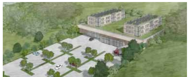
Planentwurf für den Supermarktstandort aus der Sitzungsvorlage