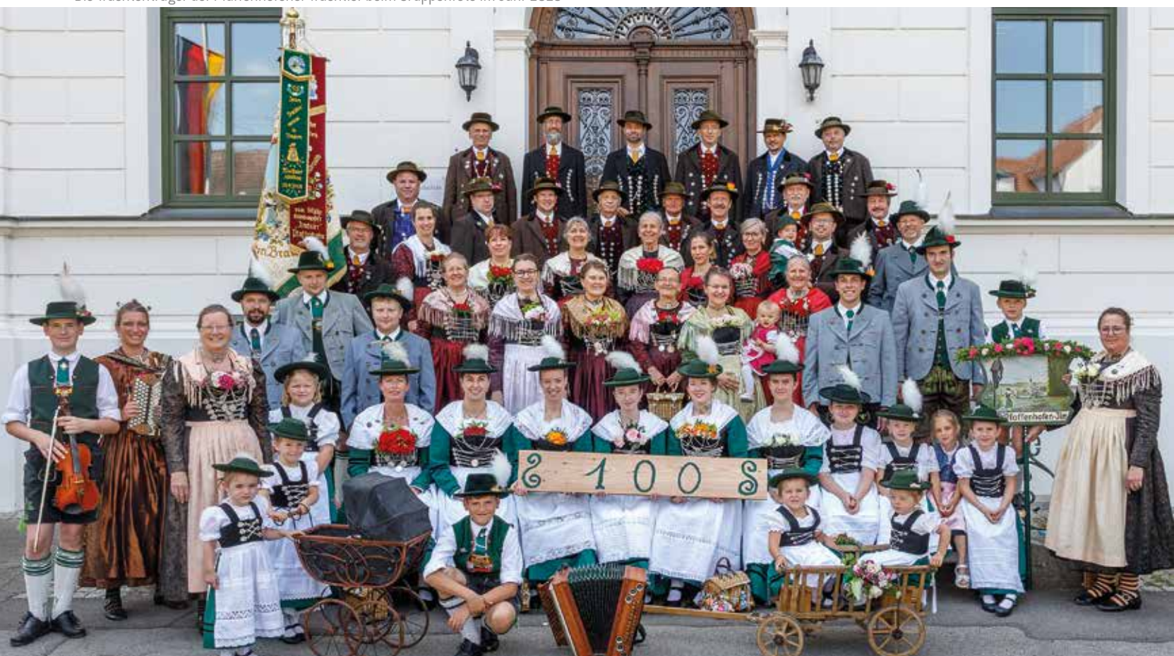
Die Trachtenträger der Pfaffenhofener Trachtler beim Gruppenfoto im Jahr 2025

nung, der Tradition und der Lebensfreude aus. Das Landesjugendtrachtenfest ist etwas Besonderes: Zum ersten Mal seit fast 20 Jahren findet das große Jugendtreffen wieder statt. Zuletzt wurde es 2007 in Altusried veranstaltet. Umso größer ist die Freude, dass Pfaffenhofen im Jubi-