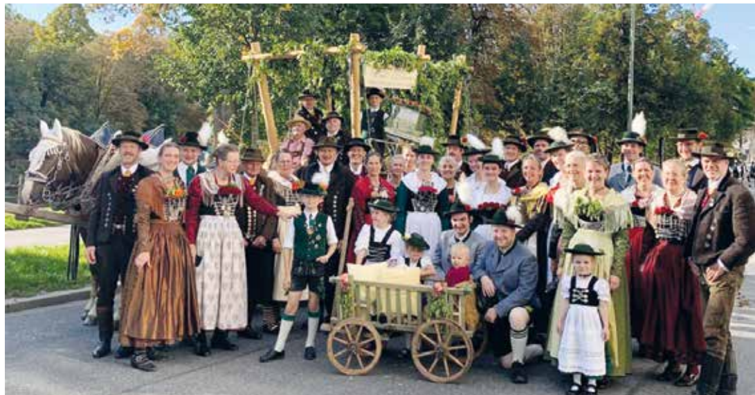
Teilnehmer der Pfaffenhofener Trachtler beim Oktoberfestzug in München 2025