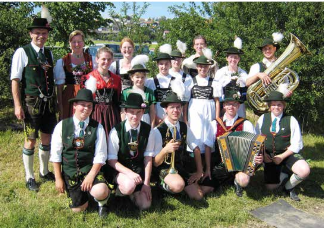
Pfaffenhofener Jugendliche und Betreuer beim Landesjugendtrachtenfest 2007 in Altusried/Allgäu