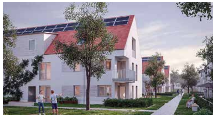
Visualisierung der Wohnanlage im Beamtenviertel