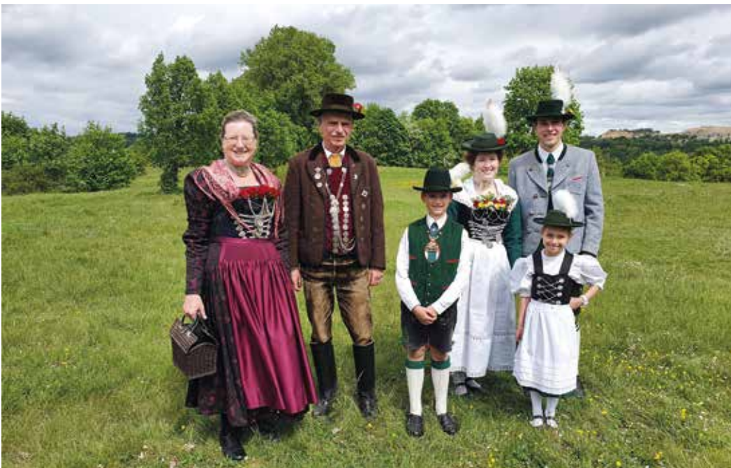
Holledauer Volkstracht, Gebirgstracht der Plattler und Jugendtracht der Pfaffenhofener Trachtler