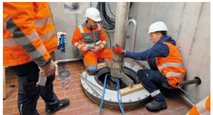
Eine neue Tiefbrunnenpumpe sichert die Trinkwasserversorgung in Pfaffenhofen.

Beim Brunnen 2 musste nun die Tiefbrunnenpumpe aufgrund eines Defekts ausgetauscht werden. Dafür wurde zunächst eine mechanische Reinigung vorgenommen. Mithilfe einer Kamera werden 72 Meter Rohre auf Schäden überprüft. Die Siebe und Filter werden anschließend mit einer Rotordüse und Vakuum gereinigt. Über mehrere Stunden dauert dieser Prozess. Werden keine Schäden und Verunreinigungen festgestellt, werden die 12 Wasserrohre mit einer Länge von 6 Metern ausgebaut und die neue Pumpe eingebaut. Anschließend wird die