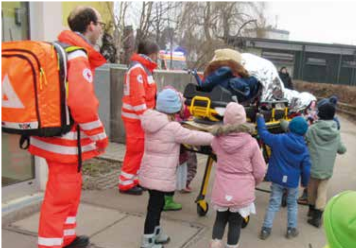
Bei der „Teddyklinik on Tour“ lernten die Kinder spielerisch den Notruf kennen.

Die Kinder der Kindertagesstätte St. Johannes durften einen ganz besonderen und spannenden Vormittag erleben: Die „Teddyklinik on Tour“ war zu Besuch.