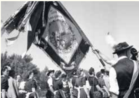
Aufnahme vom Trachtenfest 1952

Anlässlich des dritten Donaugaufestes der Gebirgstrachtenerhaltungsvereine richteten die „Ilmtaler“ im Juni 1928 mit einem zweitägigen Fest in Anwesenheit zahlreicher auswärtiger Vereine ihre Fahnenweihe aus. Triumphbögen und Fahnenschmuck bildeten den feierlichen äußeren Rahmen. Anliegen der „Ilmtaler“ war der Erhalt der guten alten Sitten und Gebräuche: „Was unsre Väter ehrten, sei uns heilig, so lang vom Himmel strahlen Weiß und Blau!“, lautete ihr Leitmotiv.