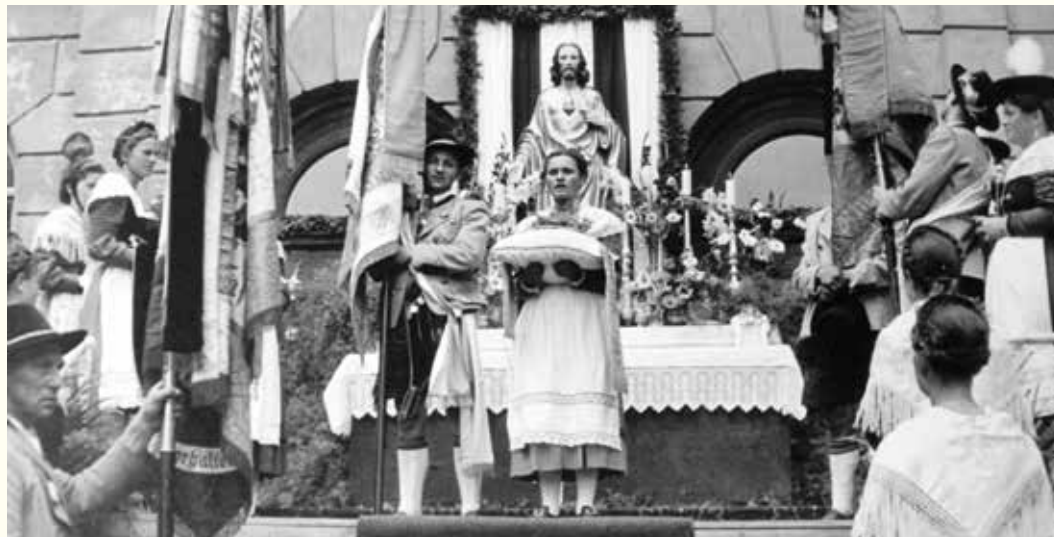
Fahnenweihe im Jahr 1952 vor der Knabenschule (heute Joseph-Maria-Lutz-Schule)