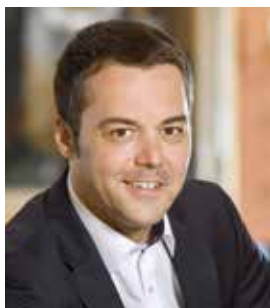
Ihr Thomas Herker Erster Bürgermeister