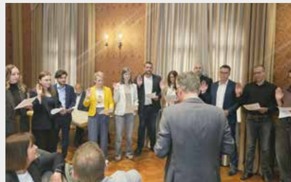
Elf neue Stadtrats-Mitglieder legten ihren Amtseid ab.