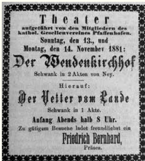
Anzeige einer Theateraufführung des kath. Gesellenvereins aus dem Jahr 1881

Bereits der 1847 gegründete Gesangverein „Liederkranz“ (heute Liedertafel) und der kath. Gesellenverein von 1858 unter dem damaligen Stadtkaplan Sailer sorgten für Theateraufführungen mit Pfaffenhofener Darstellern. Die Stücke dienten meist dazu, „gegen Sittenverderben und Gleichgültigkeit in Religion“ anzugehen, es gab jedoch auch unterhaltsame Aufführungen und Lustspiele, die