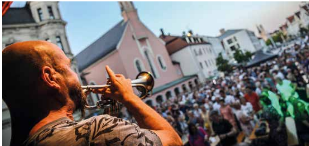
Festivalstimmung in der Stadt: Die Internationale Nacht vereint Musik, Begegnung und internationales Flair.