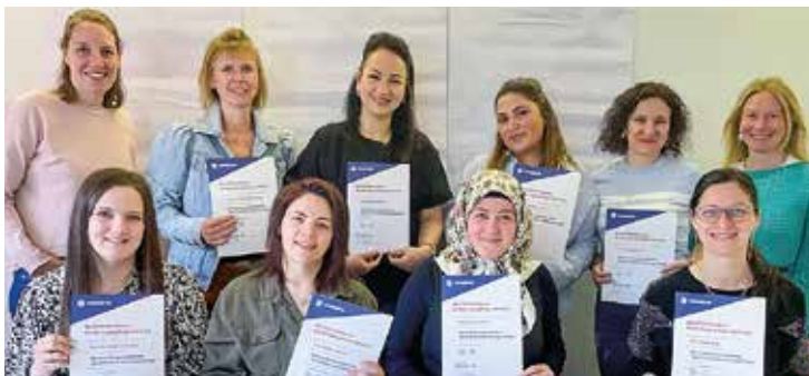
Zehn qualifizierte Kindertagespflegepersonen feiern ihren erfolgreichen Abschluss.

ZSG STEGERBRÄU "DIE RUASSIGEN" PFAFFENHOFEN