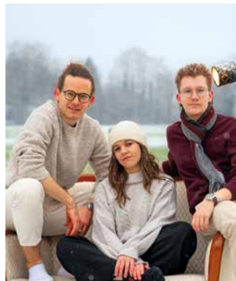
Das Trio mellow. begeistert mit energiegeladenen Sounds und spannenden musikalischen Kontrasten.