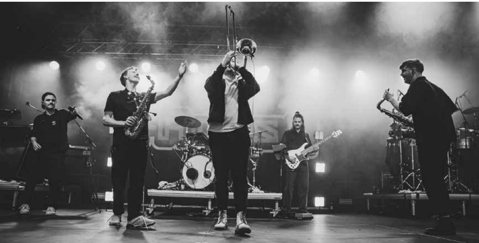
Mit ihrer energiegeladenen Mischung aus fetten Beats, starken Rap-Parts und kraftvoller Brass-Section sorgt Fättes B für Stimmung auf der Bühne.

Einer der großen Kultursommer-Höhepunkte ist das Sommer Open Air am Sonntag, 26. Juli auf dem Hauptplatz. Egal ob direkt vor der Bühne oder entspannt in einer Liege am Stadtstrand garantiert das Sommer Open Air bei kühlen Getränken, leckerem Essen und freiem Eintritt beste Abendunterhaltung. Die Besucherinnen und Besucher dürfen sich auf Fättes B freuen. Ursprünglich als Brassband gestartet, liefert die Crew jetzt einen bombastischen Mix aus „fättes“ Beats, starken Raps und einer phänomenalen Brass-Section. Bevor Fättes B Pfaffenhofen zum Beben bringen, beweisen die Pfaffenhofener Musikerinnen der Band Catcall, warum sie gleichzeitig den Jury- und den Publikumspreis beim letzten Saitensprung-Festival gewonnen haben. Mit ihrer Mischung aus Rock, Punk und Grunge versprechen sie eine einzigartige Energie auf der Bühne und bieten textlich einen gesellschaftskritischen Blickwinkel auf das aktuelle Zeitgeschehen.