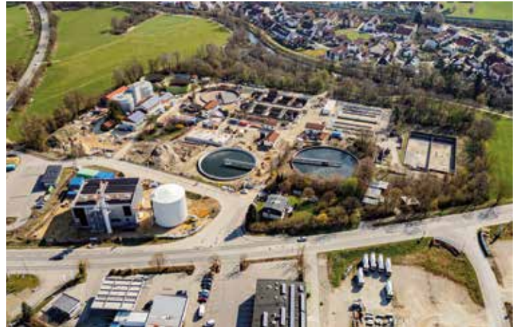
Die Arbeiten an der Kläranlage an der Joseph-Fraunhofer-Straße gehen voran.

Parallel dazu haben die Arbeiten an den Belebungsbecken 1 und 2 begonnen. Beide Anlagenteile wurden planmäßig außer Betrieb genommen und werden nun umfassend saniert und technisch auf den neuesten Stand gebracht. Die Wiederinbetriebnahme des Belebungsbeckens 1 ist für Oktober vorgesehen, das Belebungsbecken 2 soll im Dezember folgen. Mit Abschluss dieser Maßnahmen wird die Kläranlage insgesamt wieder vollständig in Betrieb gehen. Die weiteren Baumaßnahmen, darunter der Bau der neuen Fahrzeughalle, des Betriebsgebäudes sowie die Gestaltung der Außen-