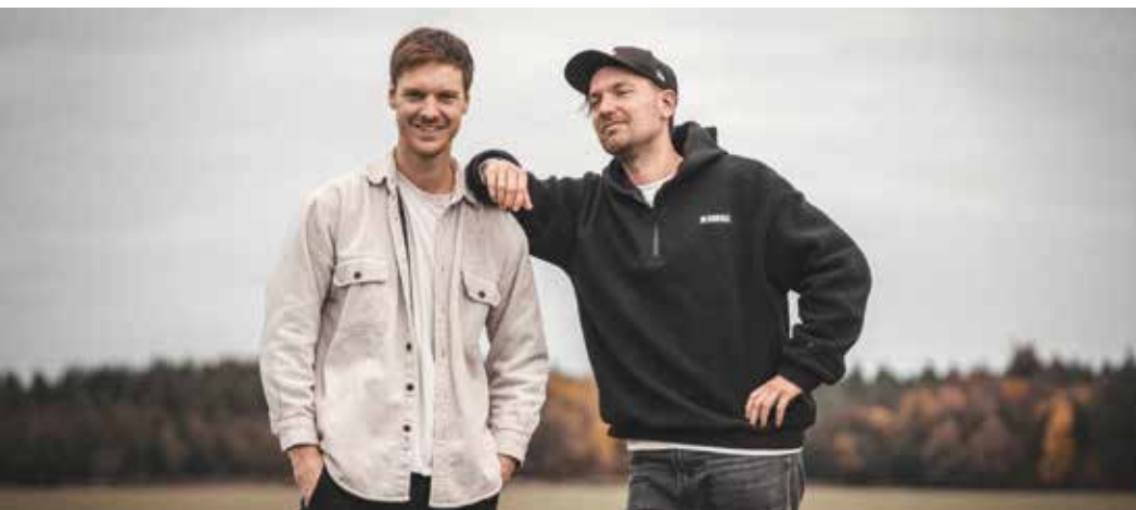
Briada verbinden bayerische Mundart mit modernen Pop-Elementen und schaffen einen besonderen Sound.

die Kinder austoben, handwerklich ausprobieren und Spaß haben.