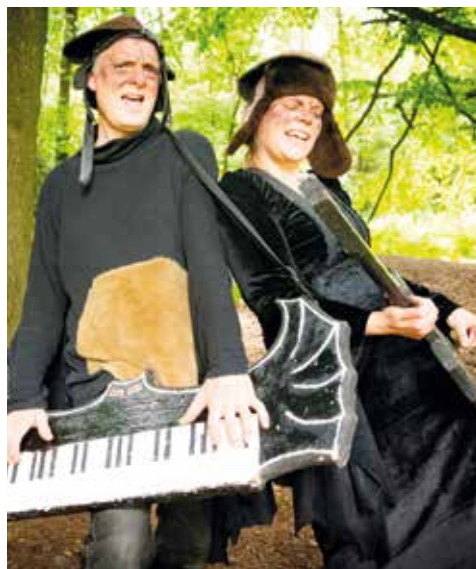
„Flattertom und Flederlilly“ lädt zu einem fantasievollen Fledermaus-Abenteuer in die Stadtbücherei ein.