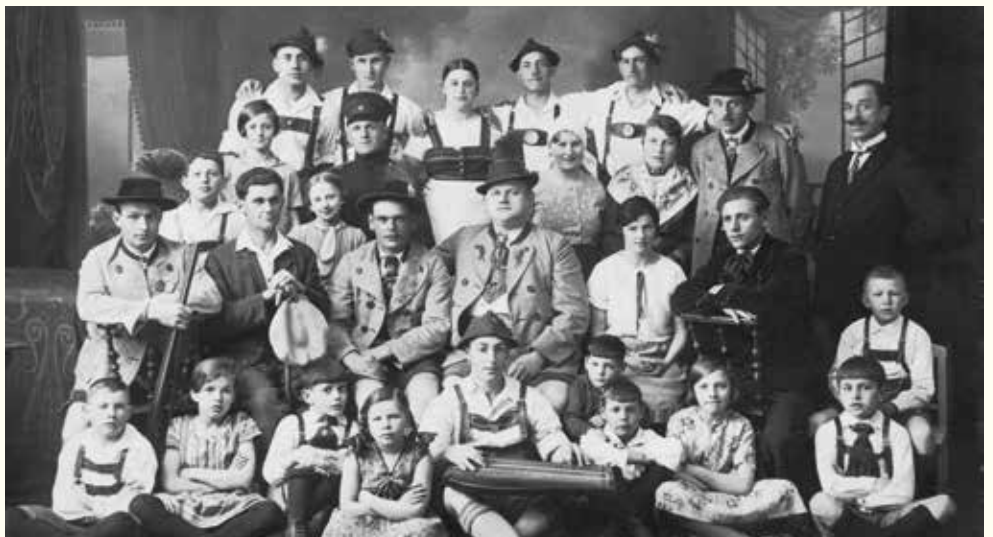
Im Jahr 1930 brachten Mitglieder des Trachtenvereins „Ilmtaler“ für einen wohltätigen Zweck das Stück „Das Vermächtnis des Wilderer“ auf die Bühne.

die Bevölkerung in die stets vollbesetzten Säle lockten.