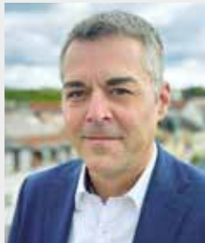
Thomas Herker (SPD) Erster Bürgermeister