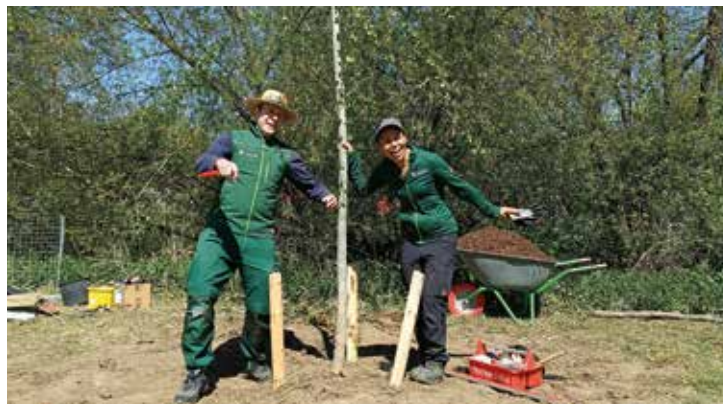
Das Team Stadtgrün pflanzt kontinuierlich klimaresiliente Bäume nach.

Die Sommer werden heißer, Trockenperioden länger und Wetterextreme häufiger – auch in Pfaffenhofen sind die Folgen des Klimawandels längst spürbar. Gerade Stadtbäume stehen dabei unter besonderem Druck und sind doch unverzichtbar: Sie spenden Schatten, kühlen ihre Umgebung, verbessern die Luftqualität und erhöhen die Lebensqualität in unserer Stadt.